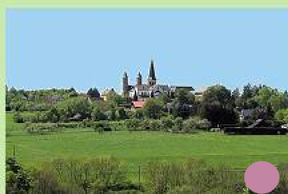
Eifelblick vom Königstein (Königsberg)