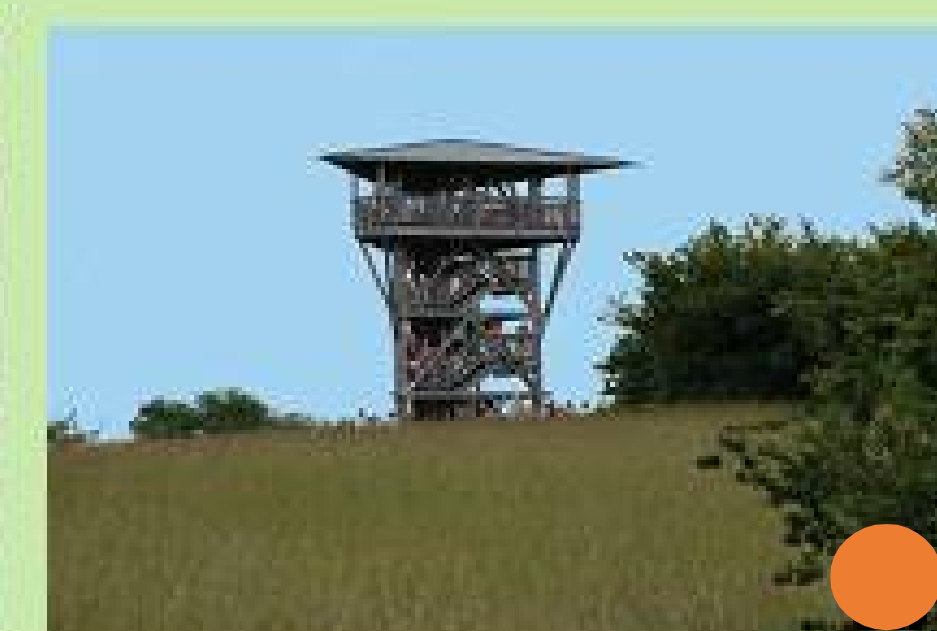
Eifelblick auf dem Mühlenberg