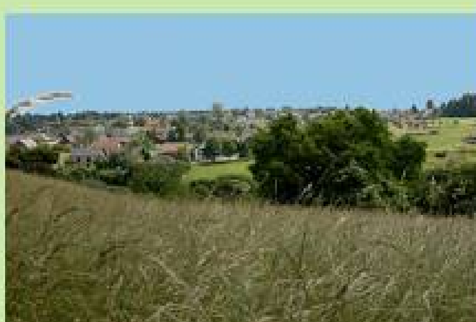
Blick auf Marmagen

Wanderkarte Nr. 5 des Eifelverein erhältlich im: Blumenladen Gänseblümchen gegenüber Eifelplatz - Milz Konditorei und Café Kölner Str. 37 - Getränkeshop J. Nagelschmidt Kölner Str. 60