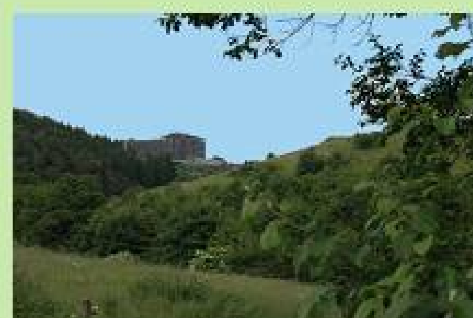
Blick auf Eifelhöhen-Klinik