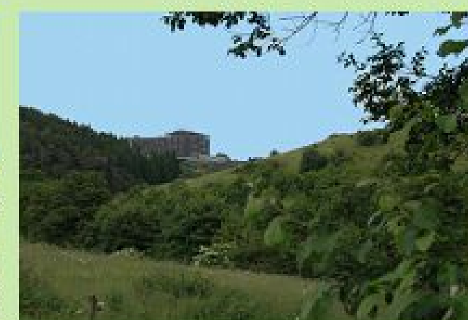
Blick auf Eifelhöhen-Klinik