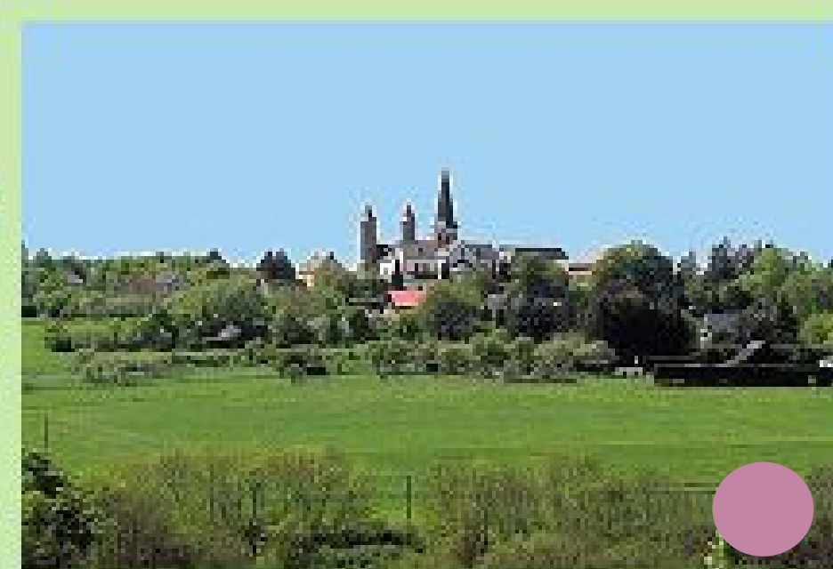
Eifelblick vom Königstein (Königsberg)