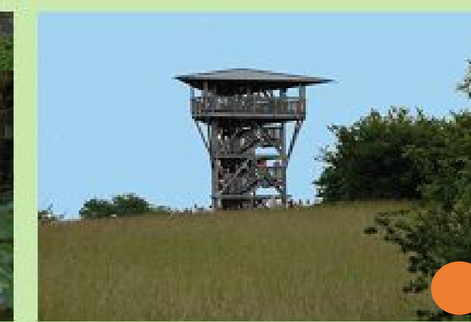
Eifelblick auf dem Mühlenberg