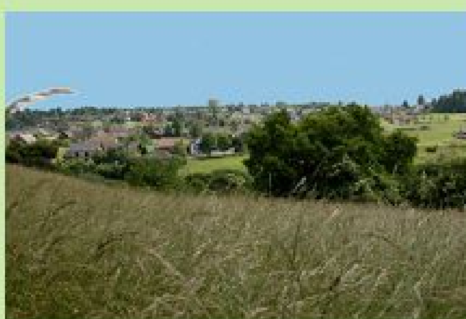
Blick auf Marmagen

Wanderkarte Nr. 5 des Eifelverein erhältlich im: Blumenladen Gänseblümchen gegenüber Eifelplatz - Milz Konditorei und Café Kölner Str. 37 - Getränkeshop J. Nagelschmidt Kölner Str. 60